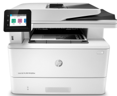
Imprimante multifonction HP LaserJet Pro M428fdn

Le secret de la réussite d'une entreprise : travailler intelligemment. L'imprimante multifonction HP LaserJet Pro M428 est conçue pour vous laisser vous consacrer aux tâches assurant la croissance efficace de votre entreprise et vous permettant de rester en tête de la concurrence.