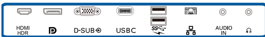
I/O back panel connector diagram